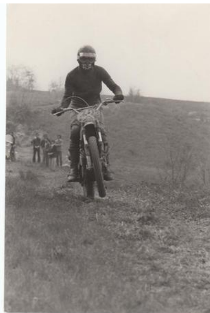
Scandiano (RE) 1973