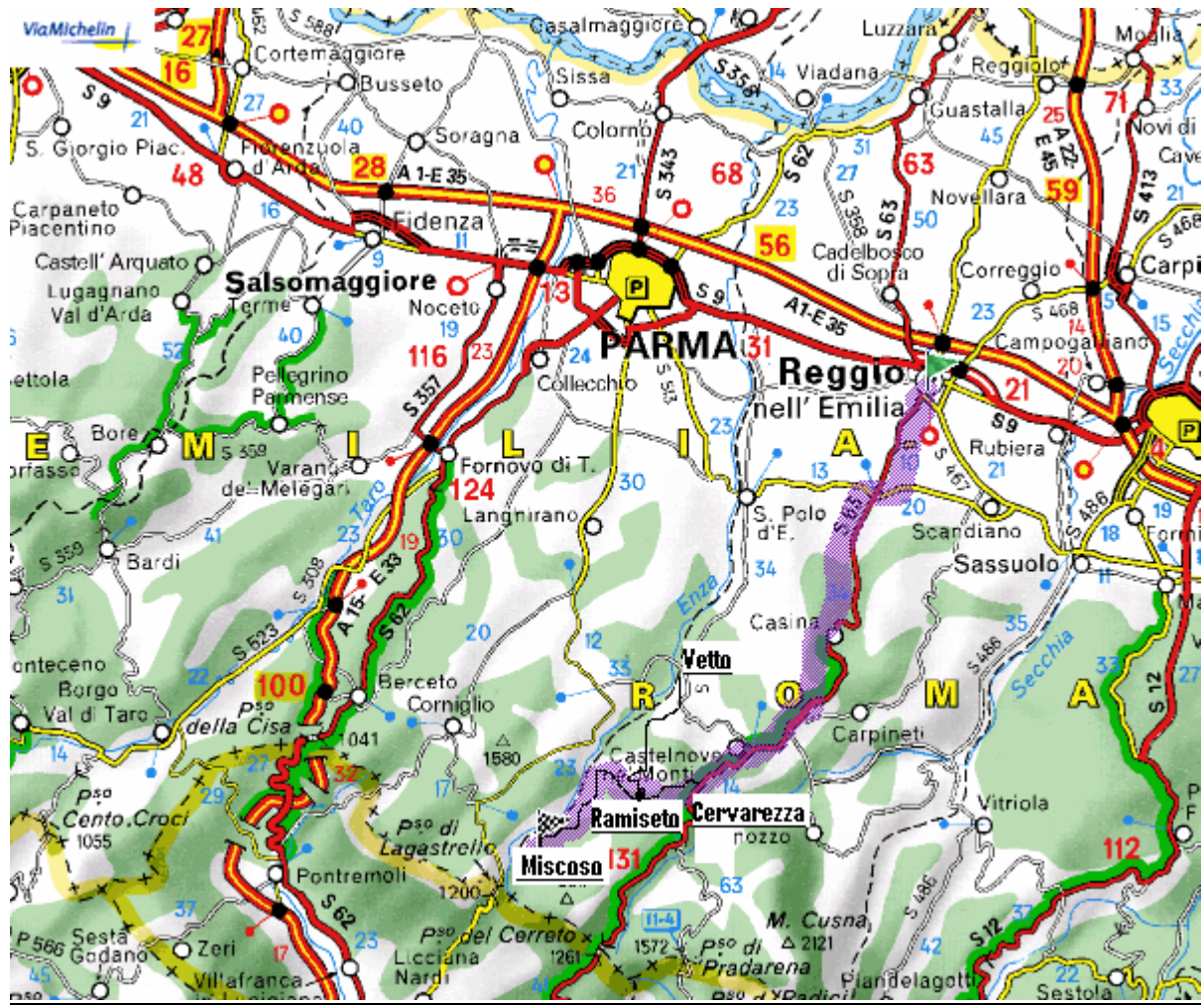
Da Aulla (Ms)